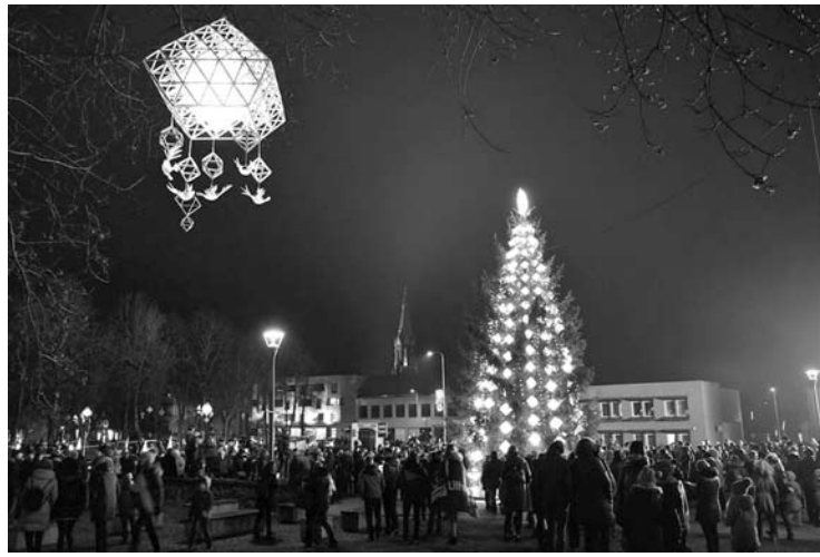
Įžiebta Anykščių miesto kalėdinė eglė sulaukė palankių atsiliepimų.

Šventiškai suspindo ir pats Anykščių miestas. Šventinis apšvietimas mažai kuo skiriasi nuo pernykščio – viešasis erdves vėl puošia M.Tursės kurti šviečiantys „sodai“, ant apšvietimo stulpų spindi Anykščių miesto ženklai ir instaliacijos. Akį režia Anykščių L. ir S.Didžiulių viešosios bibliotekos pastato apšvietimas, kurį profesionalūs architektai jau išpeikė ir įvar-