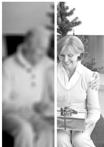
Kataraktos paveiktas regėjimas Normalus regėjimas

Katarakta (lęšiuko sudrumstėjimas) – viena pagrindinių regėjimo netekimo priežasčių pasaulyje, kurią šiuolaikiniai oftalmologijos pasiekimai leidžia sėkmingai gydyti. Pradinėse stadijose katarakta gali nesukelti regėjimo problemų, tačiau su metais drumstys ryškėja, plečiasi, kas lemia palaipsniui blogėjantį regėjimą. Sergant katarakta silpnėja matymo ryškumas, vaizdai tampa išplaukę, matomi tarsi žiūrint pro rūką. Drumstėdamas lęšiukas iškraipo spalvas, dingsta kontrastinis matymas. Kad ir kokius akinius žmogus užsidėtų matymas nepagerėja. Ligai progresuojant regėjimas silpnėja, atskiriama tik šviesa nuo tamsos ar visiškai apanka-