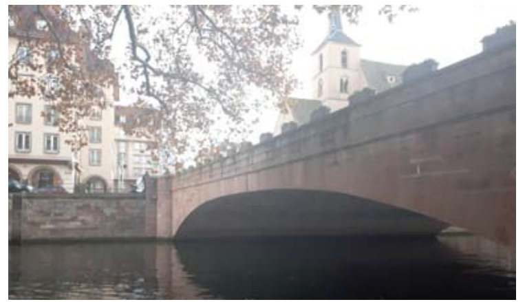
Strasbūro senamiestis yra įrašytas į UNESCO saugomų objektų sąrašą.

Vokietijos kanclerė ragino įveikti atskirų ES šalių nacionalinį egoizmą ir daugiau nuveikti kartu, solidariai. „Solidarumas reiškia, kad veikiant savais interesais reikia