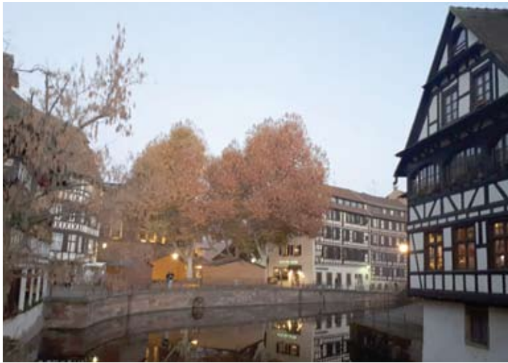
„Mažosios Prancūzijos“ kvartalas žavi fachverkinio stiliaus namais.

Tomis dienomis ne tik gatvės būna sausakimšos, bet ir viešbutį už padoresnę kainą sunku rasti. Kalbama, kad ne tik į sesijas vykstantis žurnalistai, bet ir patys parlamentarai arba bent jau jų „aptarnaujantis“ personalas nakvynei vietų ieško ne pačiame Strasbūre, o vos už keliasdešimt kilometrų esančiuose Vokietijos miesteliuose.