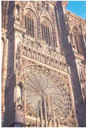
Strasbūro Notrs Damo katedros fragmentas...

pasakosiu kitame straipsnyje, nes nuotykiškai prasidėjusi kelionė negali baigtis tik brangiu bilietu į Frankfurtą.