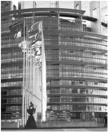
Europos Parlamentas Vokietijos kanclerės Angelos Merkel vizito metu buvo ypač saugomas.