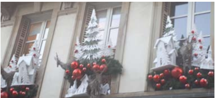
Nors Strasbūre lankiausi lapkričio viduryje, miestas jau žavėjo kalėdinėmis dekoracijomis.

Skristi tiesiai į Strasbūrą brangu – kainos prasideda nuo 500 eurų, o ir skrydžiai organizuojami su persėdimais, todėl kelionė išsitiesia pakankamai ilgai. Patogiausia skristi į Frankfurtą (Vokietija) ir likusius iki Strasbūro apie 200 kilometrų įveikti traukiniu. Taip ir dariau... Radau pigų skrydį Vilnius-Kijevas-Frankfurtas, o atgal